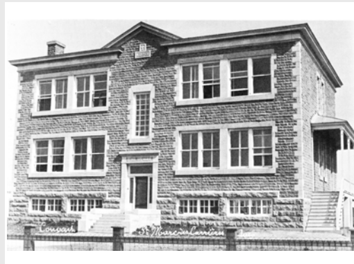
Couvent Sainte-Marie-1, sans date