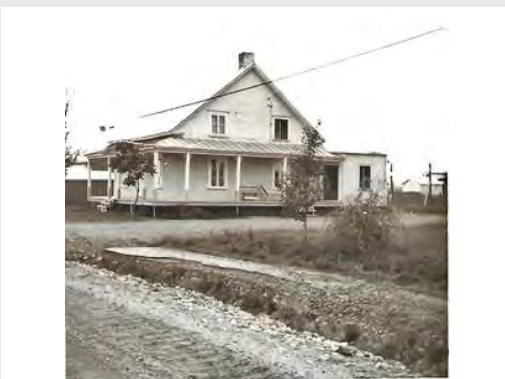
772 Rang Ste-Angélique