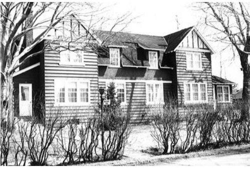
133 boulevard Saint-Laurent