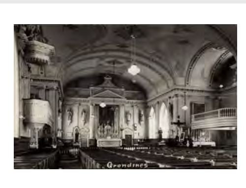
Intérieur église Grouville