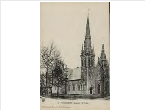
Église de Grouville, entre 1903-14