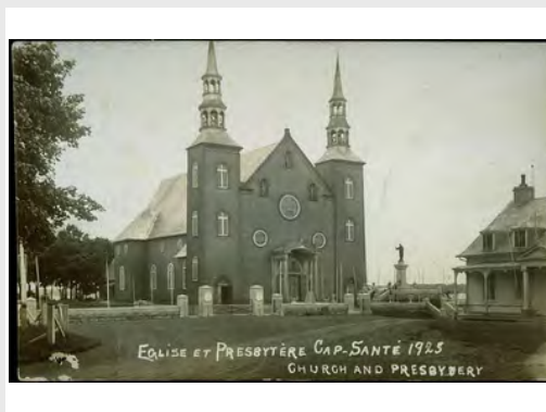
Église et presbytère, 1925