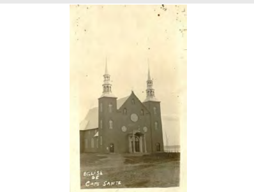
Église Cap-Santé-1, sans date